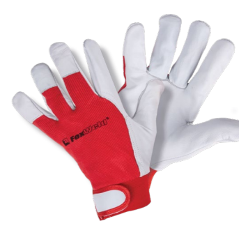
FOXWELD «СПАРТА» P-01 Арт. 7767

РАЗМЕР 10/XL МАТЕРИАЛ ЛАДОНИ/ТЫЛЬНОЙ СТОРОНЫ КОЖА БУЙВОЛА/СИНТЕТИКА ПОДКЛАД НЕТ