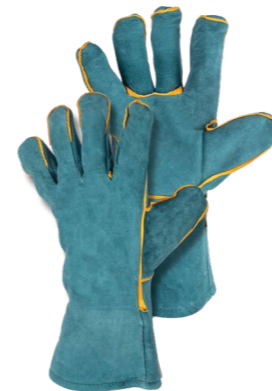
FOXWELD ЗЕЛЕННЫЕ Арт. 6323/6114

РАЗМЕР 11/XXL МАТЕРИАЛ ЛАДОНИ / ТЫЛЬНОЙ СТОРОНЫ КОРОВИЙ СПИЛОК ПОДКЛАД ТВИЛЬ + ФАНЕЛЬ