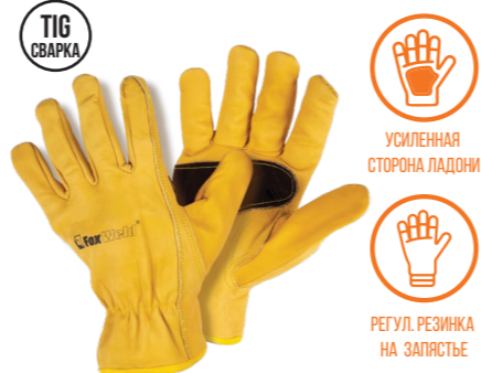
FOXWELD «МИНЬОН» СА-04 Арт. 7771

РАЗМЕР 10/XXL МАТЕРИАЛ ЛАДОНИ / ТЫЛЬНОЙ СТОР. КОРОВИЙ СПИЛОК/КОЖА БУЙВОЛА ПОДКЛАД НЕТ