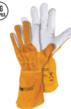
FOXWELD «МУСТАНГ» КС-03 Арт. 8498

РАЗМЕР 11/XXL МАТЕРИАЛ ЛАДОНИ / ТЫЛЬНОЙ СТОР. КОЗЬЯ КОЖА/КОРОВИЙ СПИЛОК ПОДКЛАД НЕТ