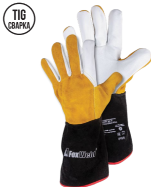
FOXWELD «ПРОФ» КС-01 Арт. 8495

РАЗМЕР 10/XXL МАТЕРИАЛ ЛАДОНИ / ТЫЛЬНОЙ СТОРОНЫ КОЗЬЯ КОЖА ПОДКЛАД НЕТ