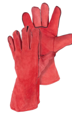
FOXWELD КРАСНЫЕ Арт. 6324/5949

РАЗМЕР 11/XXL МАТЕРИАЛ ЛАДОНИ / ТЫЛЬНОЙ СТОРОНЫ КОРОВИЙ СПИЛОК ПОДКЛАД ТВИЛЬ + ФАНЕЛЬ