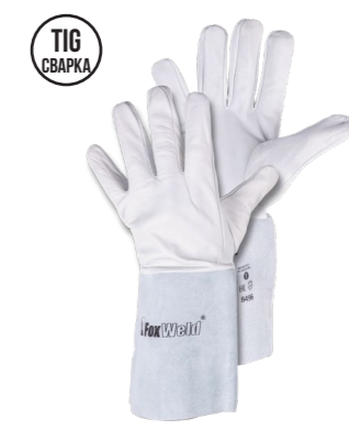
FOXWELD «ЕВРО» СА-08 Арт. 8496

РАЗМЕР 11/XXL МАТЕРИАЛ ЛАДОНИ / ТЫЛЬНОЙ СТОРОНЫ КОРОВИЙ СПИЛОК ПОДКЛАД ТВИЛЬ + ФАНЕЛЬ