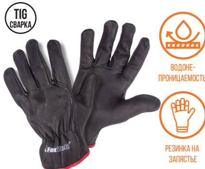
FOXWELD «ПАНТЕРА» СА-07 Арт. 7776

РАЗМЕР 9,5/L МАТЕРИАЛ ЛАДОНИ / ТЫЛЬНОЙ СТОРОНЫ РЕЗИНА / СИНТЕТИКА ПОДКЛАД НЕТ