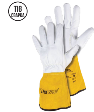
FOXWELD «ВЕКТОР» КСА -09 Арт. 8497

РАЗМЕР 10/XXL МАТЕРИАЛ ЛАДОНИ / ТЫЛЬНОЙ СТОР. КОЗЬЯ КОЖА/КОРОВИЙ СПИЛОК ПОДКЛАД НЕТ