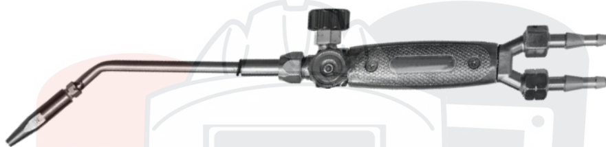
Рис.1- Общий вид горелки

Горелка состоит из ствола и комплекта наконечников. Ствол горелки имеет регулировочные вентили кислорода и пропан-бутана. К стволу по резиновым рукавам